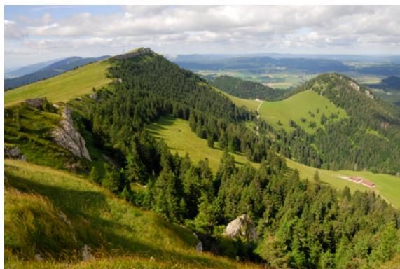
Balcon du Jura