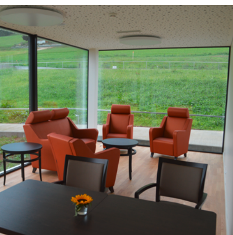
Petit salon de l'EMS