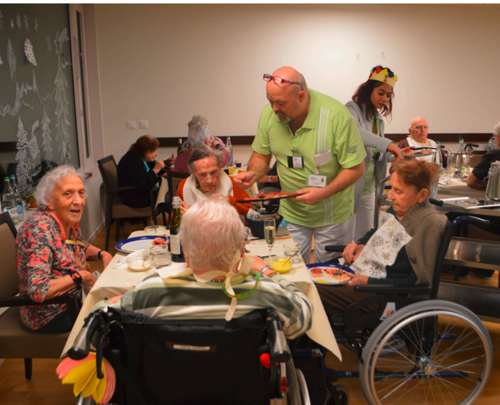
Moment de repas au sein d'une unité de vie

Sur un plan médical, nous disposons des compétences d'un médecin spécialisé en gériatrie qui bénéficie d'une longue expérience professionnelle.