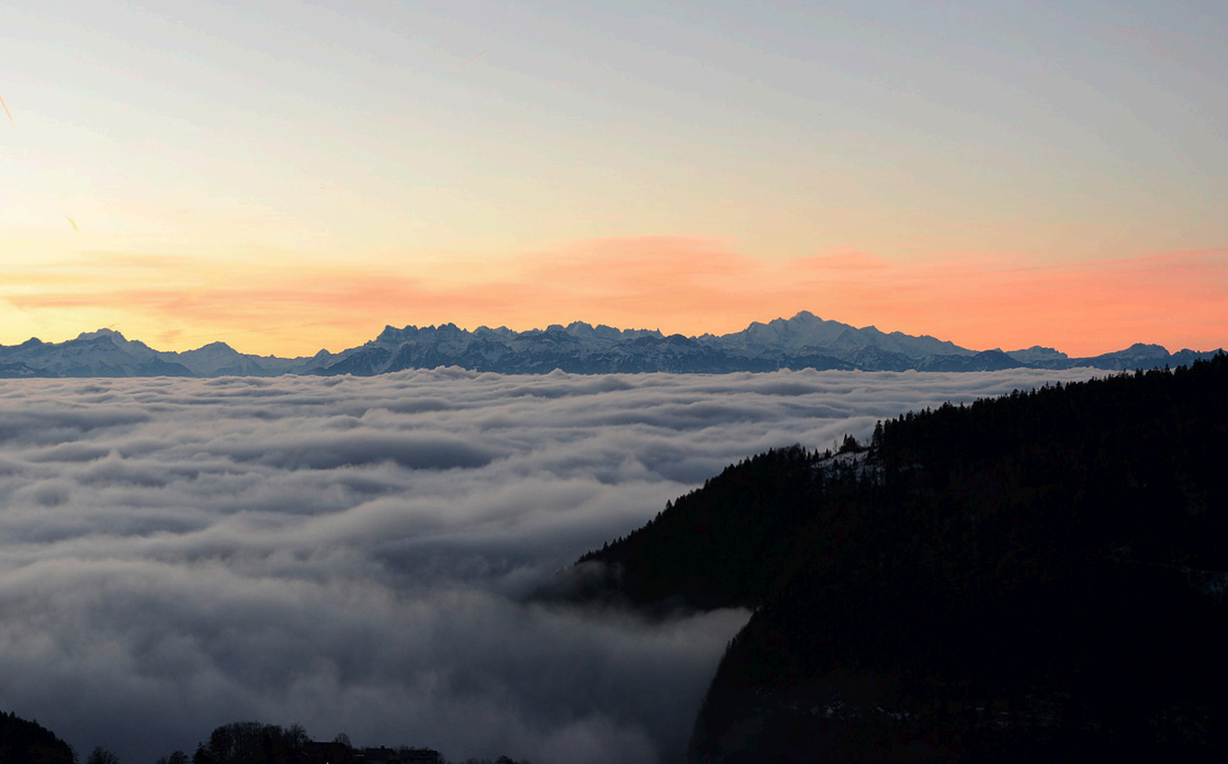
Vue sur les Alpes depuis le Balcon du Jura