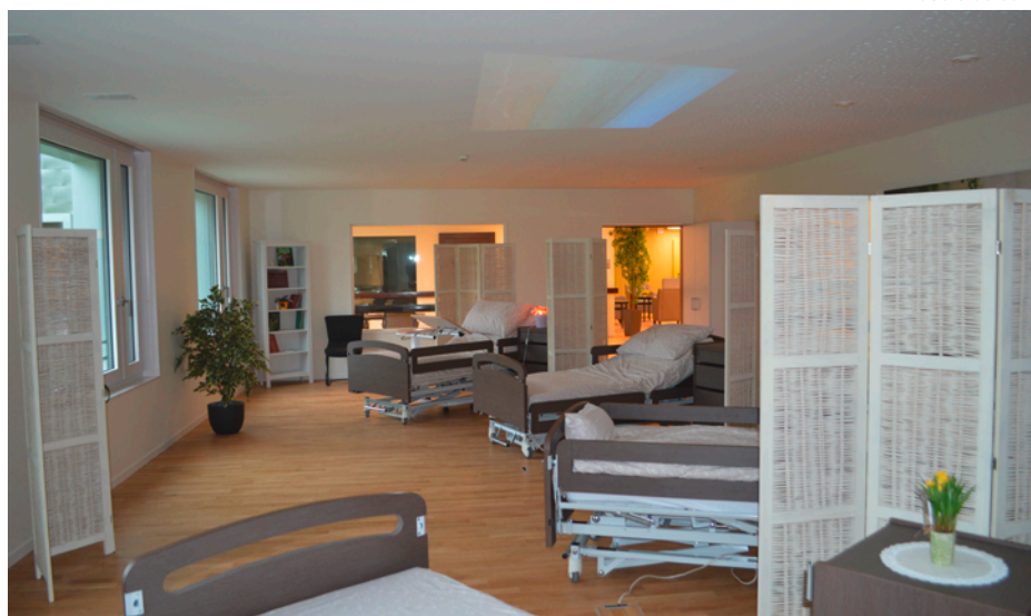
L'Oasis de soin