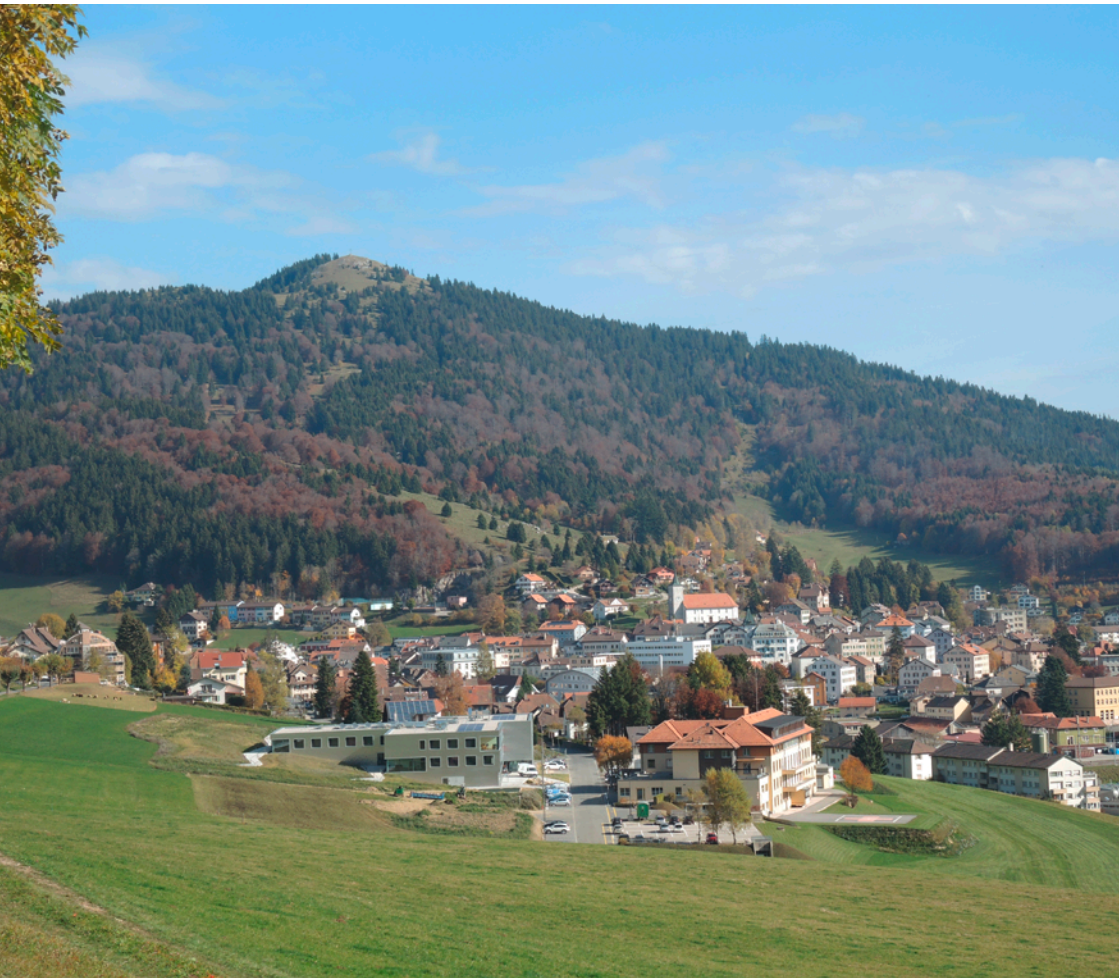
Vue sur Sainte-Croix et le site hospitalier et médico-social du RSBJ