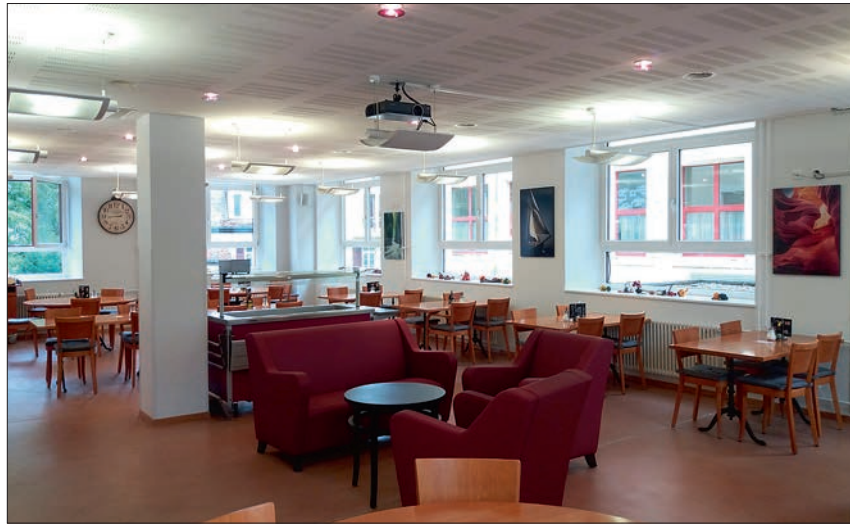
La décoration du restaurant a été revue au printemps.

Cet établissement public, accessible à tous, propose un menu différent tous les jours, une spécialité hebdomadaire ainsi qu'un buffet de salades frais. Des activités ponctuelles sont proposées par les structures d'accompagnement médico-social (SAMS) telles qu'un loto, de la gymnastique ou un après-midi thématique. Des matches aux cartes sont régulièrement agendés.