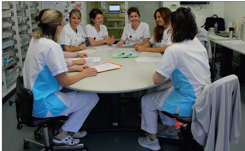
Un colloque interdisciplinaire se réunit toutes les semaines pour aménager un programme de soins sur mesure pour chaque patient.

Plusieurs syndromes gériatriques sont analysés dans les domaines spécifiques de la diététique, la cognition, la force motrice et les déplacements ou encore l'intégrité cutanée. Le médecin, le personnel infirmier, la physiothérapeute, l'ergothérapeute ou encore la diététicienne effectuent une évaluation des besoins dans les premières 24 heures d'hospitalisation. Cette équipe interdisciplinaire confronte ses évaluations lors d'un colloque hebdomadaire. Un plan de soins est alors établi pour le patient. « L'objectif est de lui offrir les meilleures