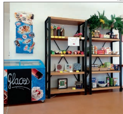
Un coin épicerie a été aménagé. On y trouve des produits de première nécessité.

Horaires d'ouverture du lundi au dimanche de 9h à 14h