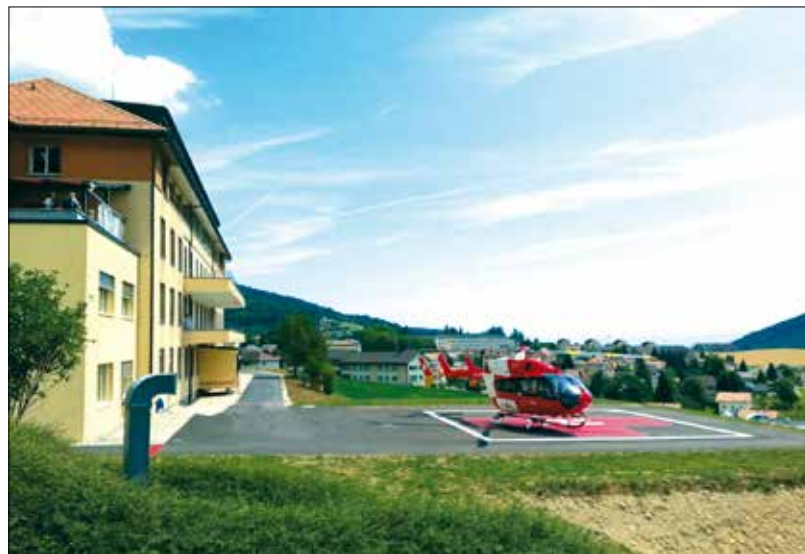
Le nouvel hélicoptère du Réseau Santé Balcon du Jura est fonctionnel.

Quant au corps principal du bâtiment, les parties est et centrale du radier (plate-forme maçonnée qui est la base de départ du bâtiment) sont terminées. Les murs commenceront à être montés dès la reprise des travaux prévue le lundi 17 août. Quant à la partie ouest du radier, elle interviendra après le démontage de la « petite » grue située côté Gittaz.