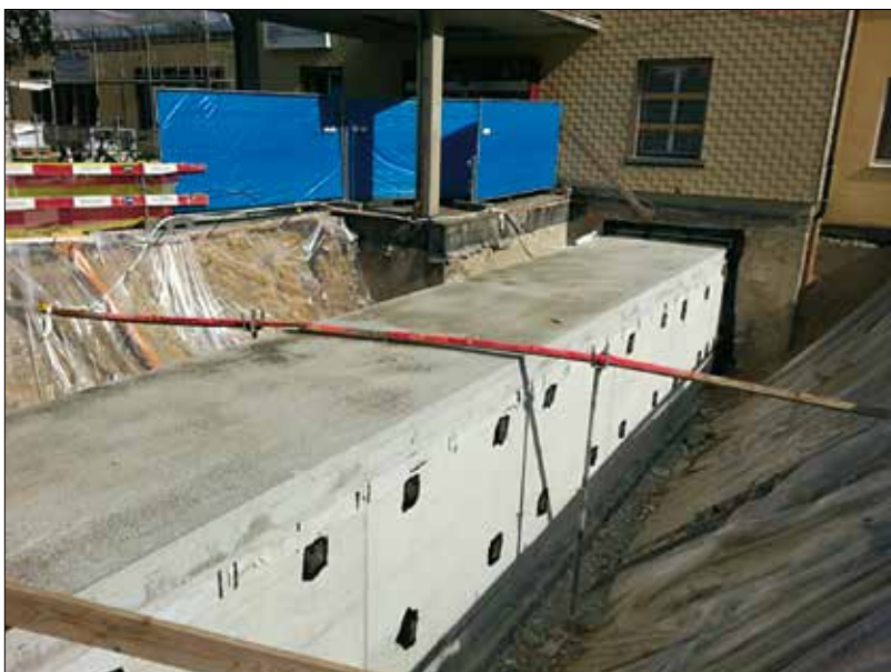
Le tunnel qui relie l'hôpital et le futur EMS est réalisé.

Très à l'aise avec la communication, il se réjouit de vous accueillir au guichet ou au téléphone afin de répondre à vos demandes, les lundis, mercredis et jeudis.