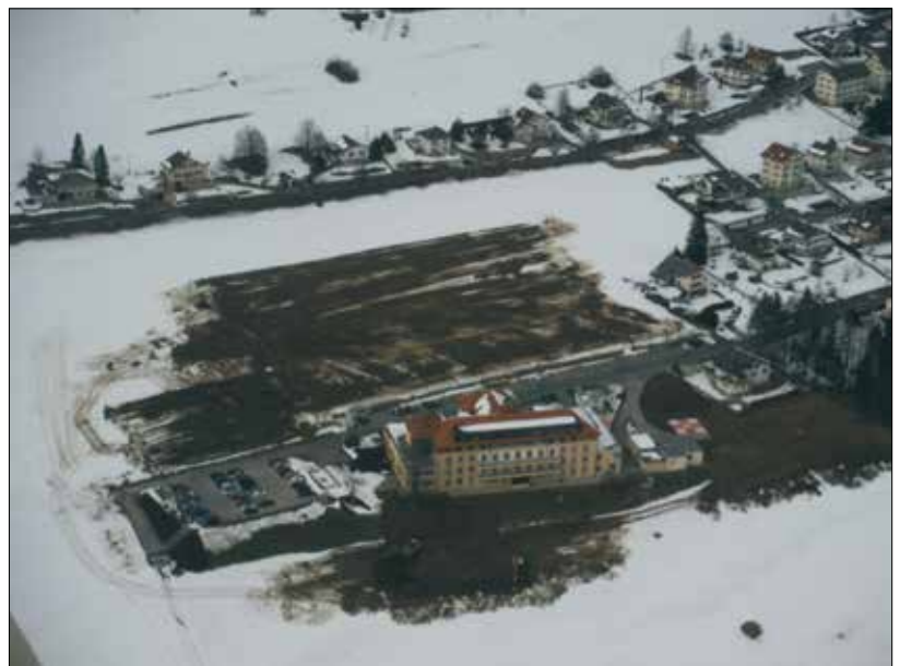
Les terrains où seront construits l'EMS et l'hélicoptère sont dégagés.

Dès la fin de sa construction, soit début mai, ce parking sera affecté aux collaborateurs du CSSC, en place de