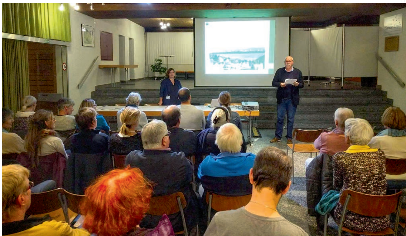
Le projet a été présenté à la population le 5 octobre dernier.

Afin de mieux comprendre les besoins de la région, deux méthodes seront utilisées : des entretiens individuels à domicile et à travers les deux plateformes.