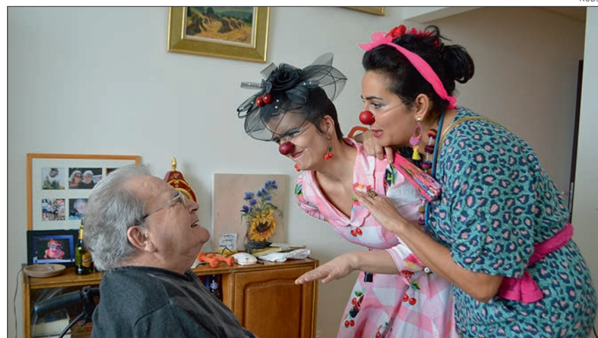
Capter l'attention, établir le contact par la poésie, le rire, les chants ou la danse. Un instant d'évasion souvent apprécié par les résidents de l'EMS.

L'association « Fil rouge » est née en 2012 dans l'impulsion de plusieurs clowns qui ont désiré intervenir auprès de personnes âgées en hôpitaux ou en